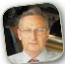
J-Claude ZYV Arpaillargues et Aureillac